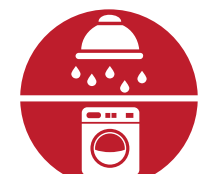
Douches et service de buanderie

MYTHE : Une personne sans abri doit payer pour utiliser un abri d'urgence à Sudbury.